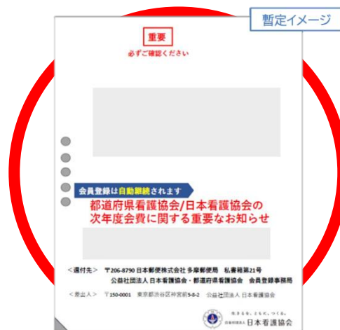
圧着ハガキ(三つ折り・Z折り)