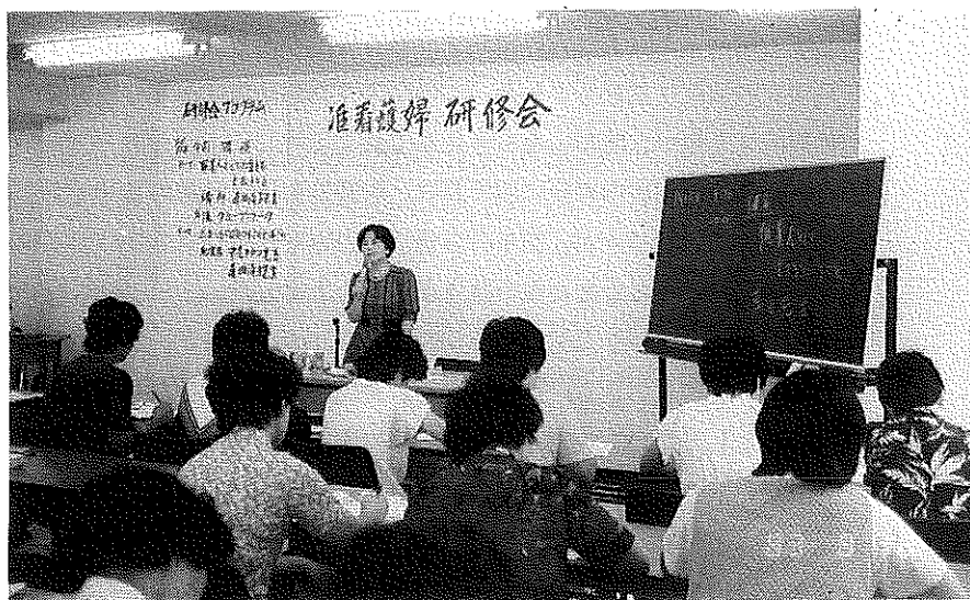
昭和58年 准看護婦研修会