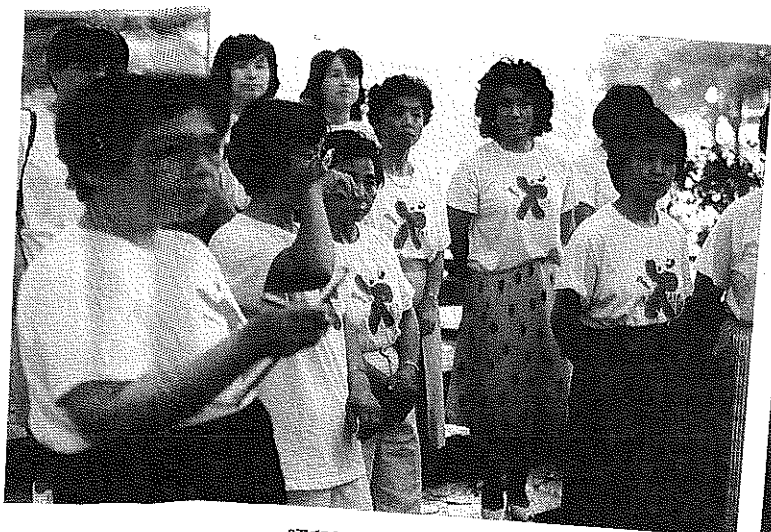
昭和61年 老人看護月間