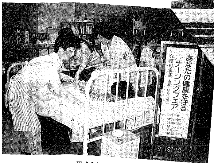
平成2年 老人看護月間