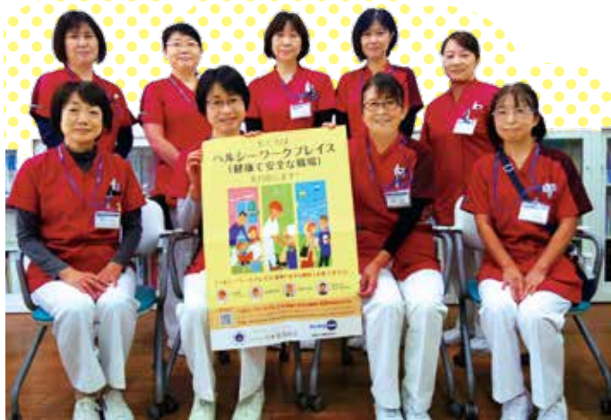
医療法人社団有相会 最成病院