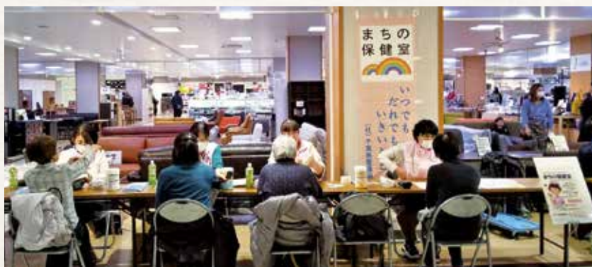
血圧、体脂肪測定から健康相談まで対応中です

印旛地区部会では「まちの保健室」を昨年、常設型で8回開催しました。骨密度や血圧の測定を目的に開始時間前から来られる方や、毎回楽しみにしているという方、生活習慣病の相談をする方な