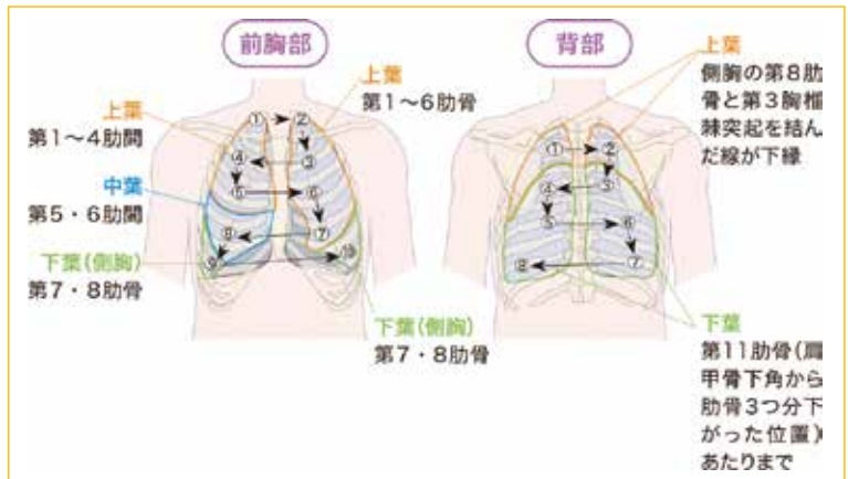
図 呼吸音の聴取部位

図引用文献：新東京病院看護部：本当に大切なことが1冊でわかる循環器第2版、照林社、P246,2020(図は照林社の承諾を確認し、掲載)