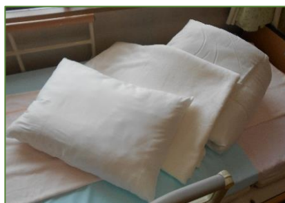
ディスポの寝具(枕・布団・綿毛布)

サージカルマスク・アルコール・エプロン 使い捨ての寝具・袖付きエプロン・フェース シールドなど在庫管理の徹底。