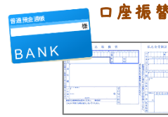
銀行振込・コンビニ収納